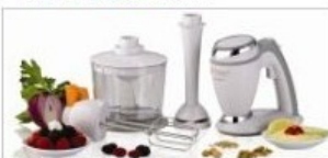
I ROBOT DA CUCINA