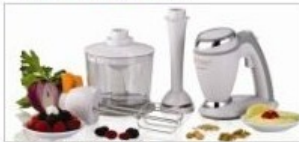
I ROBOT DA CUCINA