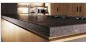
I TOP DA CUCINA