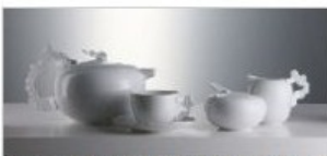
MACEF: ANTICIPAZIONE DAL SETTORE ACCESSORI PER LA TAVOLA